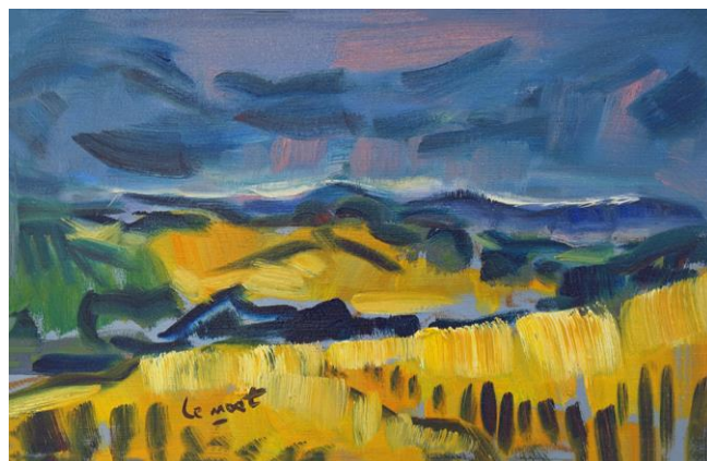
Champ de blé en juillet à Merléac . © Alain Le Nost ADAGP.