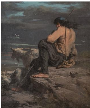
Pâtre sur les rochers de Plounéour