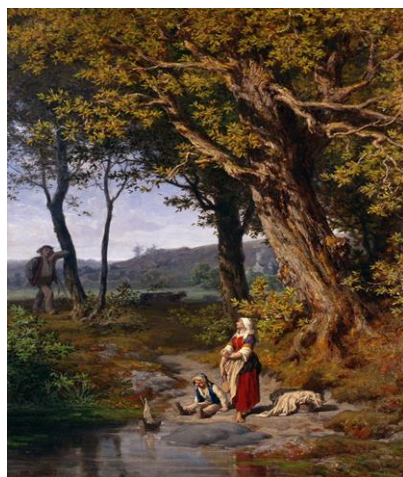
Idylle bretonne