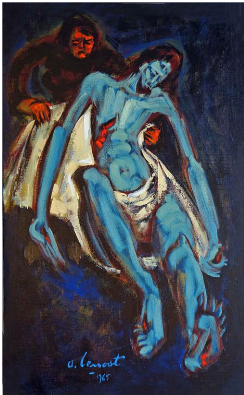
Déposition de croix , © Alain Le Nost. ADAGP