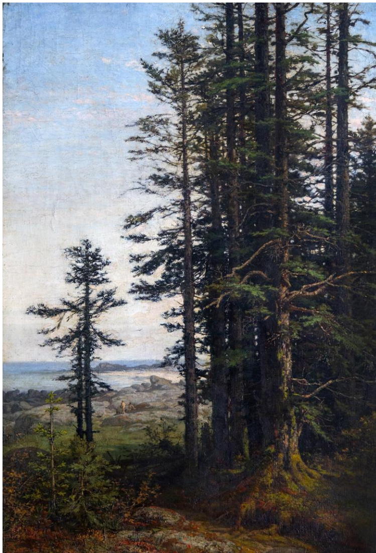
Les Pins de Ploudalmezeau , vers 1888, huile sur toile, 119 x 78 cm © Musée Y'an' Dargent St Servais Photo Albert Penneç