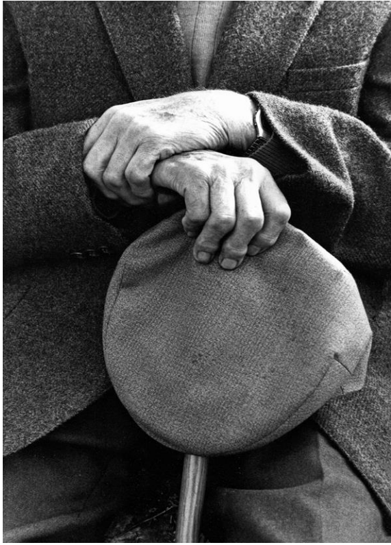
Le rendez-vous du « paysan »